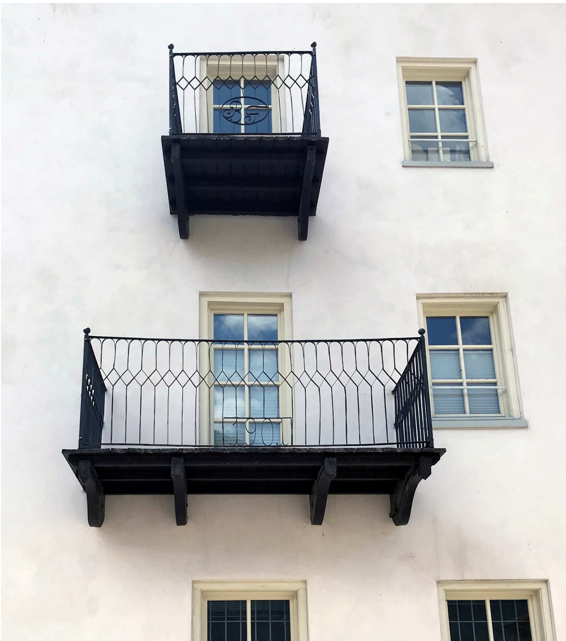
Eines der Jakob Wittmer zugeschriebenen Häuser an der St. Johann Straße: auch die Balkone mit dem Geländer aus Schmiedeeisen, den Initialen des Besitzers und dem Baujahr kennzeichnen die Bauten.

Holzbeschaffung zurückzuführen ist. Ein weiteres Merkmal vieler dieser Bauten war ein Dach aus Betonziegeln, die man in der profanierten Kirche von St. Johann eigens gegossen hat. Die nach den Dorfbränden einsetzende, rege Bautätigkeit stagnierte mit dem Beginn des Ersten Weltkrieges und nahm erst ab den späten 1950er Jahre erstaunliche Ausmaße an, die das Erscheinungsbild des ursprünglichen Straßendorfs Taufers nachhaltig verändert haben.