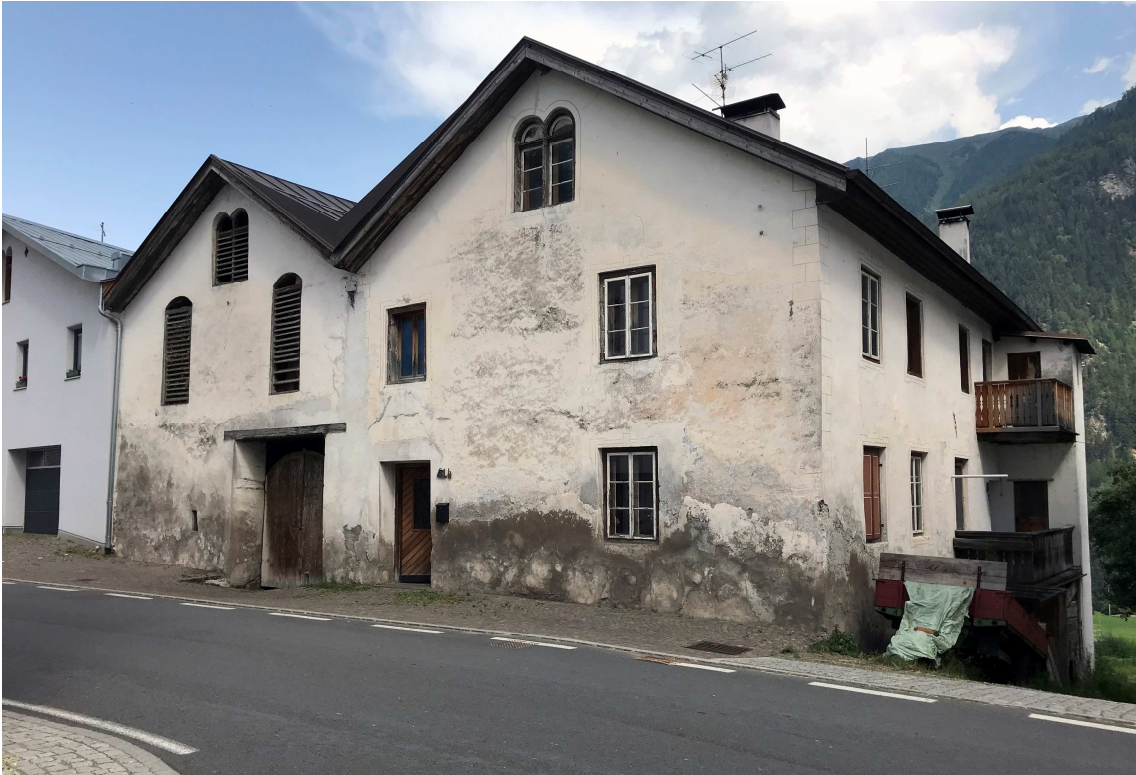
Häuserzeile mit „Trascenda“ (Durchlass nach Feuerschutzverordnung) an der St. Johann Straße

Das Toni-Felix-Haus ist in diesem Ensemble ein Sekundärelement, d.h. eines mit untergeordneter Bedeutung. „Diese Elemente können bedingt und unter Berücksichtigung des Gesamterscheinungsbildes des Ensembles verändert werden“, so Mitterer. Für B.P. 113/1 und 113/2 gelten folgende Erhaltungsmaßnahmen: