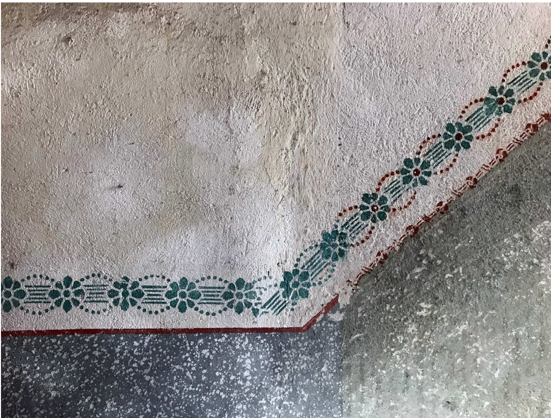
Ein Rest der Schablonenmalerei im Treppenhaus des Familie Rufinatscha.